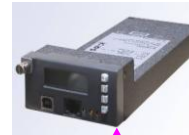
MODULO DE CONTROL ACX

Para WINDOWS – Redes IP / Arquitectura Cliente – Servidor WEB / SNMP