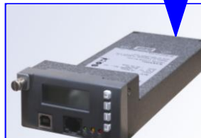
MODULO DE CONTROL ACC