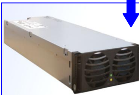
MODULO RECTIFICADOR FMPe 30.48 48Vcc – 2.900 W - 60A