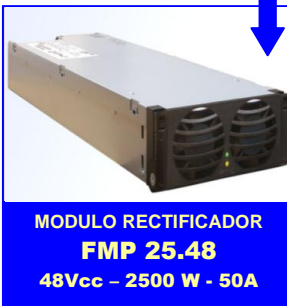
MODULO RECTIFICADOR FMP 25.48 48Vcc - 2500 W - 50A