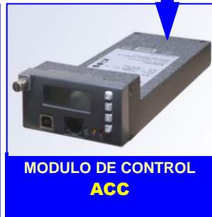
MODULO DE CONTROL ACC