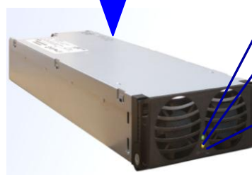
MODULO RECTIFICADOR FMPe 30.48 48Vcc – 3.000 W – 60A

LED VERDE (POWER ON) SEÑALIZACION DE TENSION DE ENTRADA DENTRO DE MARGENES Y MODULO OK