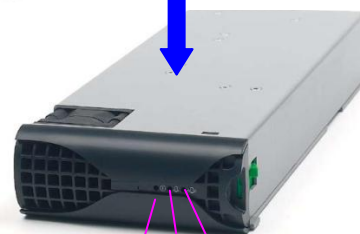
MODULO RECTIFICADOR RM 1024 24Vcc - 1000 W - 40 A

LED VERDE (AC) SEÑALIZACION DE TENSION DE ENTRADA DENTRO DE MARGENES Y MODULO OK