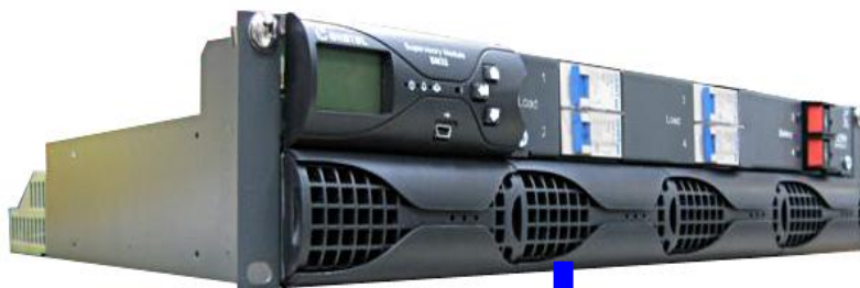
MODULO RECTIFICADOR RM 1024 24Vcc - 1000 W - 40 A