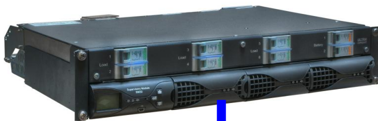
MODULO RECTIFICADOR RM 1024 24Vcc - 1000 W - 40 A