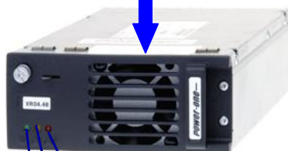
MODULO RECTIFICADOR XPGe 12.48 48Vcc – 1.200 W – 22,4 A

LED VERDE (POWER ON) SEÑALIZACION DE TENSION DE ENTRADA DENTRO DE MARGENES Y MODULO OK